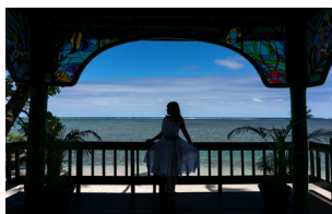
焦距：24mm 曝光：F/10 1/1250秒 ISO200