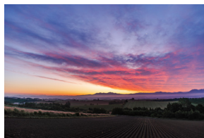
焦距：20mm 曝光：F/2.8 1/40秒 ISO100