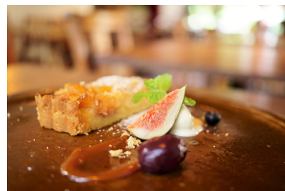
焦距：35mm 曝光：F/2.8 1/25秒 ISO800

三款镜头的最近拍摄距离分别为 F050: 0.11m, F051: 0.12m, F053: 0.15m, 最大摄影倍率均达到1:2。消除了无法靠近被摄体的困扰，能拍出近处物体更大，远处物体更小的特有透视效果。通过靠近被摄体，可将背景虚化加大，拍摄出个性丰富的作品。